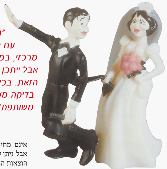
הצילומים מתוך הספר "זוג שממים" מאת עו"ד בני דן-חייא, בהוצאת רקיע

"רוב המומחים סוברים שמשמורת משותפת אינה עולה בקנה אחד עם טובת הילדים. הטעם העיקרי הוא שילד זקוק בדרך כלל לבית אחד מרכזי, במיוחד לאחר המשבר הקשה שעובר עליו עם התפרקות המשפחה. אבל ייתכן שהמערכת הטיפולית עדיין לא ניערה מספיק את האבק מעל הדעה הזאת. בכל מקרה, יש להיזהר מאוד בהחלטה בנושא הזה, כיוון שיש לערוך בדיקה מעמיקה ומעקב אחר תגובות הילדים המצויים בהסדר של משמורת משותפת"