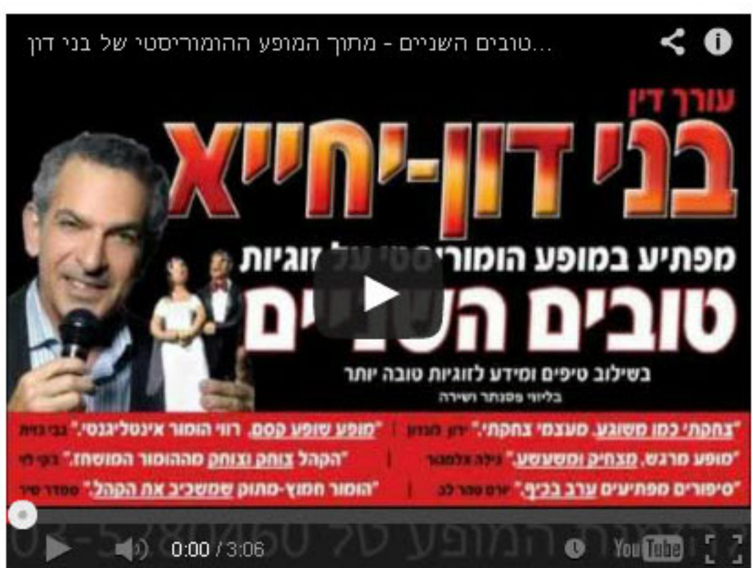
מתוך המופע "טובים השניים"

הפדיחה בהופעה של חיי היתה... במופע שלי על זוגיות "טובים השניים" אני שואל את הקהל אם צריך לומר תמיד את האמת או שעדיף לשקר מדי פעם. הופעתי פעם בפני עורכי דין. הם לא הבינו את השאלה.